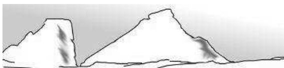
tuleň - medveď