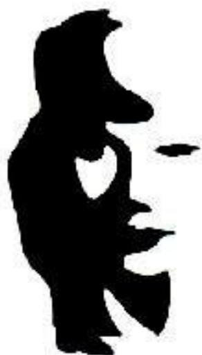
saxofonista - ľudská tvár