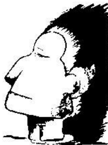
eskimák zozadu - indián